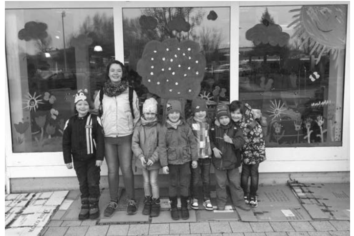
*Hier die stolzen Kinder nach der Gestaltung ihres Kunstwerks*

...am Mittwoch, den 30.03. machten sich die „Großen“ der Spatzenburg auf den Weg zu Mayer's Markenschuhe. Ein wichtiger Termin stand bevor, das Schaufenster sollte frühlingshaft mit Farben gestaltet werden.