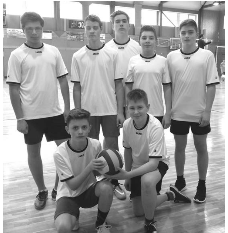
Die Mannschaft der 7. Klassen