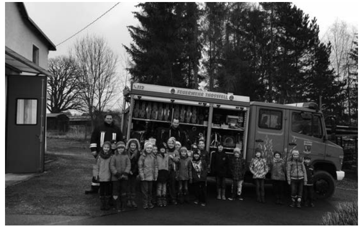
Besuch in der FFW Thoßfell