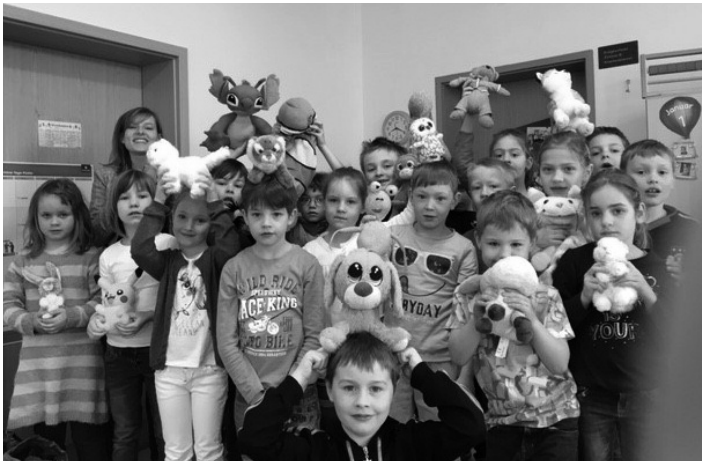
Klasse 1 Talsperrenschule Thoßfell