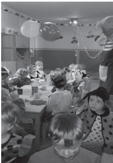
Das gemeinsame Frühstücksbuffet war der Beginn eines aufregenden Faschingsdienstags mit lustigen Spielen, einer Modenschau und vielem mehr.

Mit liebem Faschingsgruß verabschieden sich die kleinen und großen Spatzen aus Hartmannsgrün bis zum nächsten Mal!