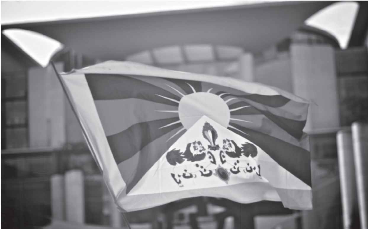
Die tibetische Flagge wird jährlich in mehr als 1000 Kommunen gehisst.

Am 10. März hisst die Stadt Treuen, am Rathaus die tibetische Flagge und setzt sich damit für die Einhaltung der Menschenrechte in Tibet ein. Treuen beteiligt sich damit an der Kampagne „Flagge zeigen für Tibet!“ der Tibet Initiative Deutschland e.V. (TID), um ein