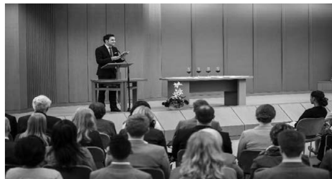
Wie bei den ersten Christen werden Brot und Wein als Symbol gereicht

Zeugen Jehovas in Ihrer Nähe finden Sie auf: www.jw.org -> Über uns -> Zusammenkünfte