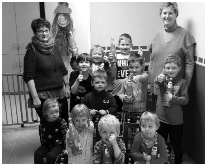
Freude bei Kindern und Erzieherinnen über die Saftspende.

Die Kinder und Erzieher aus dem Kindergarten „Spatzenburg“