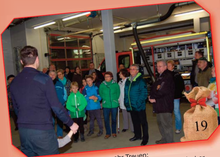
Feuerwehr Treuen: Rundfahrten mit dem Feuerwehrauto und ein filmischer Rückblick in die Vergangenheit der Feuerwehr