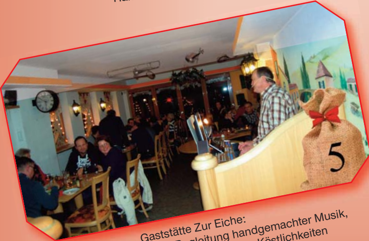
Gaststätte Zur Eiche: Weihnachtliche Weisen in Begleitung handgemachter Musik, hausgemachtem Punsch und kleinen Köstlichkeiten