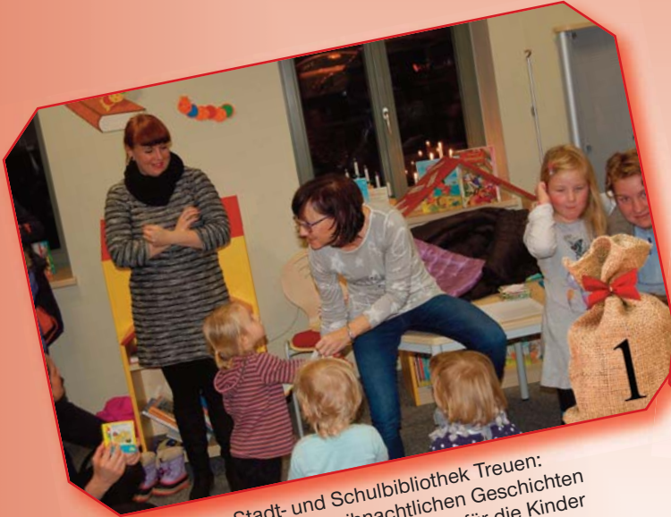
Stadt- und Schulbibliothek Treuen: Vorlesen von weihnachtlichen Geschichten und später Überraschungen für die Kinder

Nachfolgend einige Impressionen der vollkommen gelungenen Veranstaltungsreihe: