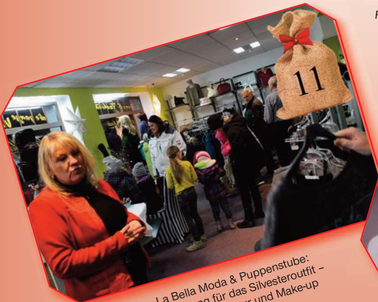
La Bella Moda & Puppenstube: Typberatung für das Silvesteroutfit - Beratung zu Frisur und Make-up