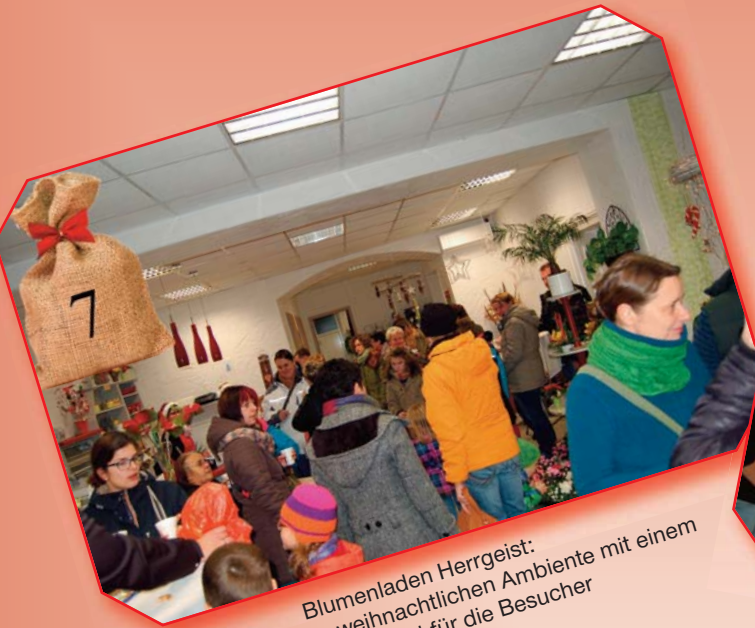
Blumenladen Herrgeist: Tagesausklang im weihnachtlichen Ambiente mit einem kleinen Präsent für die Besucher