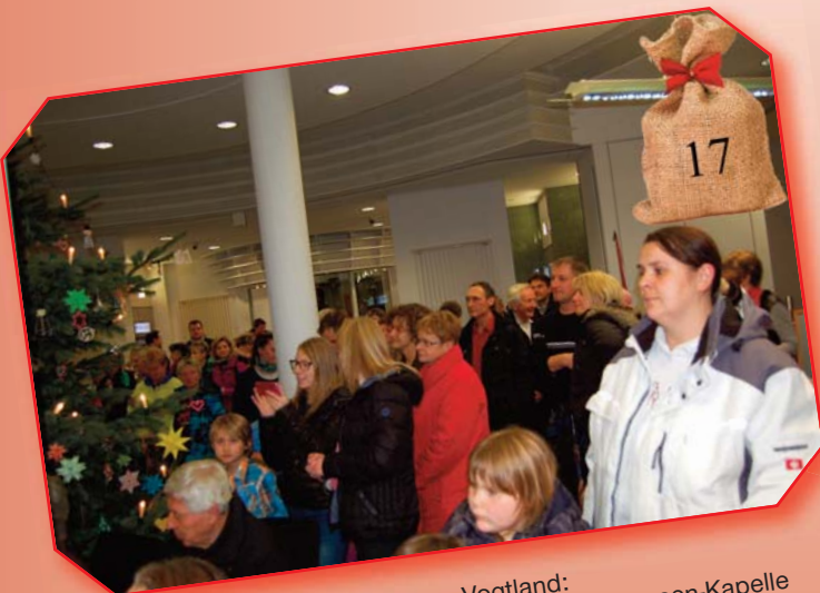
Sparkasse Vogtland: Weihnachtliche Lieder gespielt von der Sparkassen-Kapelle