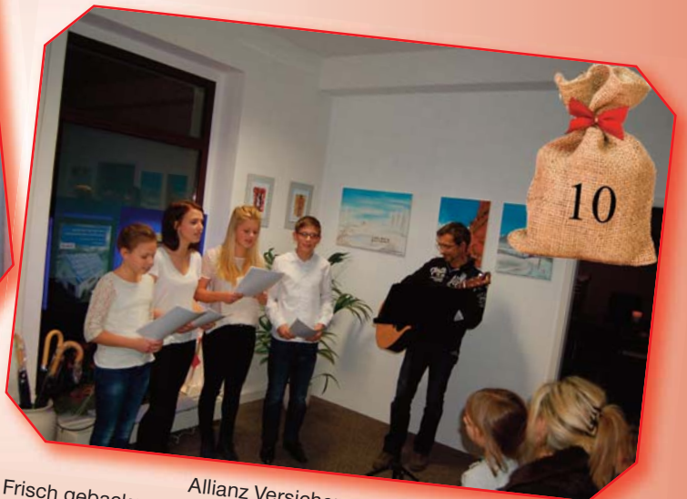
Allianz Versicherung Weißflog: Frisch gebackene Krapfen und Glühwein. Ein privater Kinderchor singt Weihnachtslieder