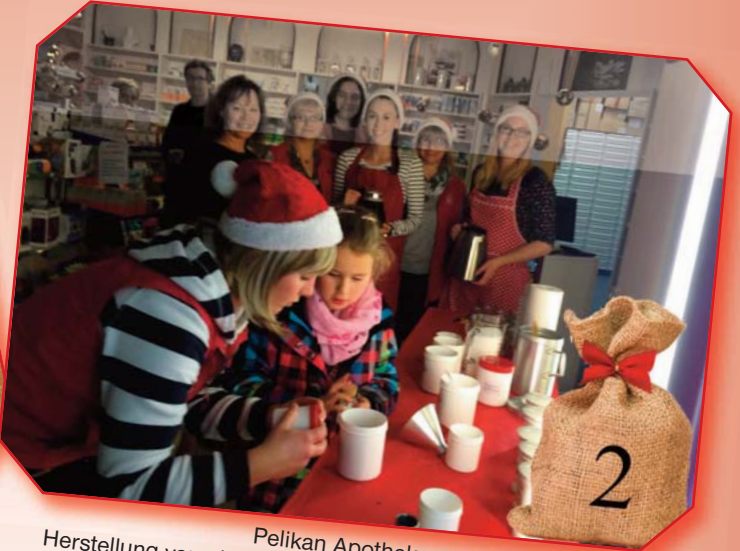
Pelikan Apotheke: Herstellung von eigenem Badesalz, auch zum Verschenken