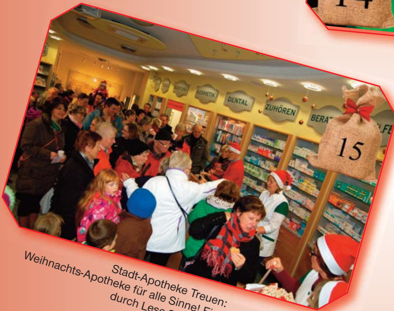
Stadt-Apotheke Treuen: Weihnachts-Apotheke für alle Sinne! Ein kultureller Beitrag durch Lese-Stücke ;-)