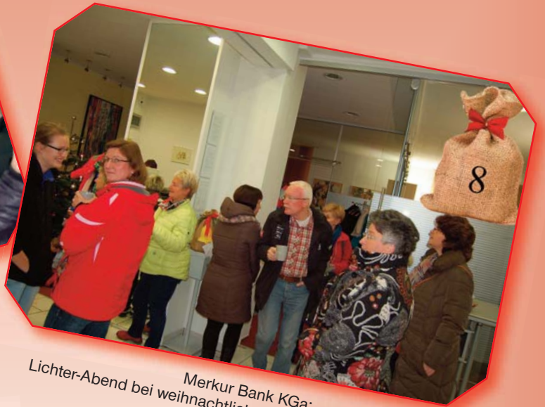
Merkur Bank KGa: Lichter-Abend bei weihnachtlichen Klängen, Geschichten und Selbstgebackenem