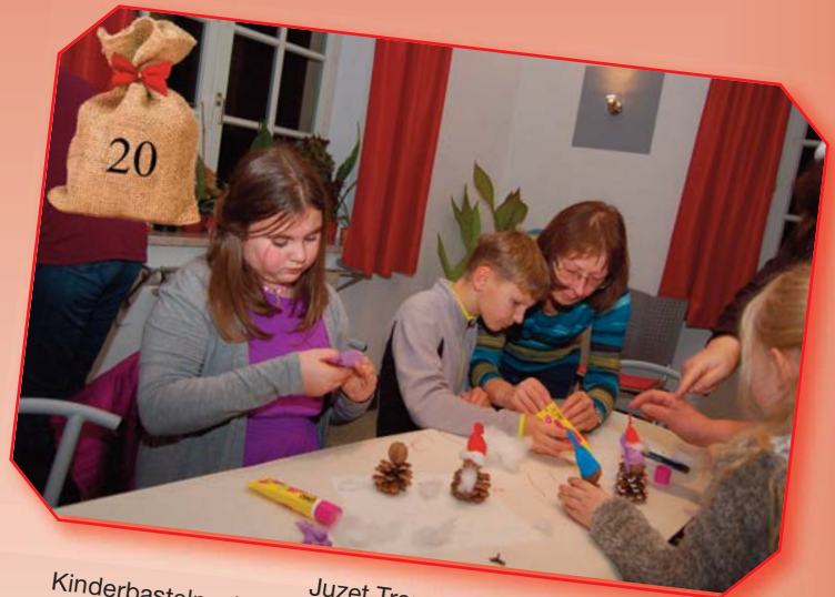
Juzet Treuen: Kinderbasteln, chinesisches Tischtennisturnier und Verkos- tung einer leckeren Kürbissuppe