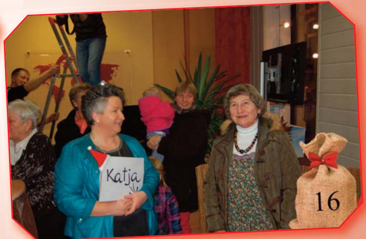
Reisebüro Sommersonne: Eine musikalische Weihnachts-Weltreise für die Besucher