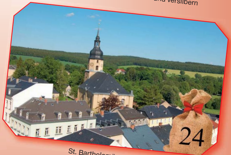
St. Bartholomäus Kirche: Krippenspiel und Christvesper