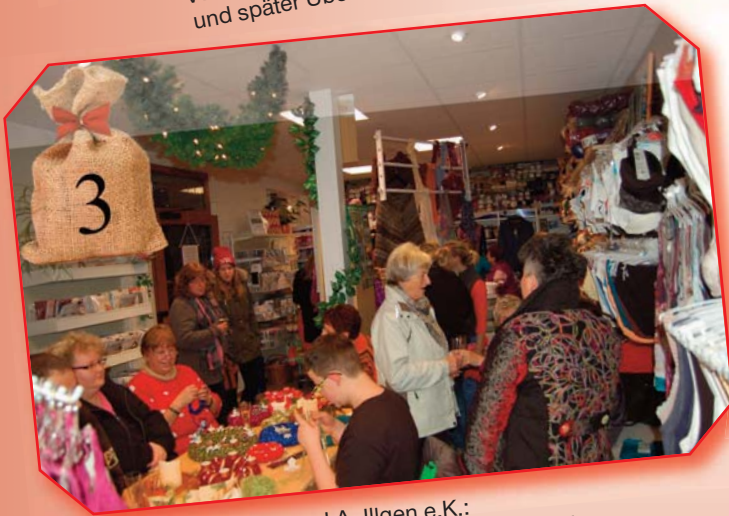
J.A. Illgen e.K.: Handarbeitsabend, Adventskranz stricken