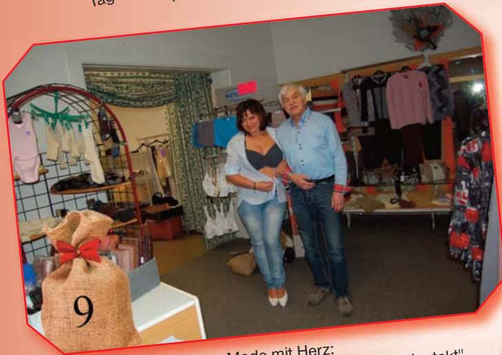
Kraus Mode mit Herz: Modenschau mit Schürzen und Dessou's im "Studentakt"