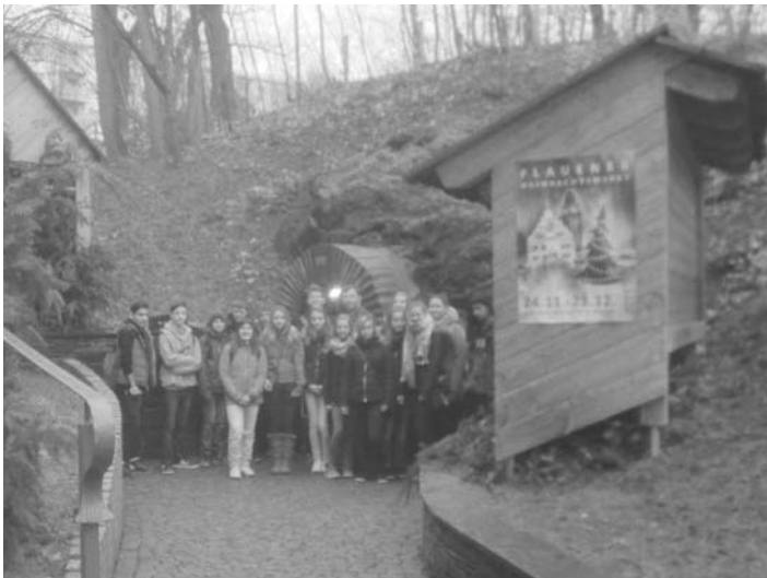
Die Klasse 8a vor dem „Einfahren“ in das Alaunbergwerk an der Plauener Reichsstraße.