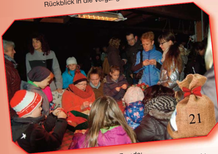
Rhapsodie Franda: Kinderglühwein am Lagerfeuer und eine Weihnachtsgeschichte erzählt von der Kräuterfrau, außerdem basteln von Schmunzelsternchen