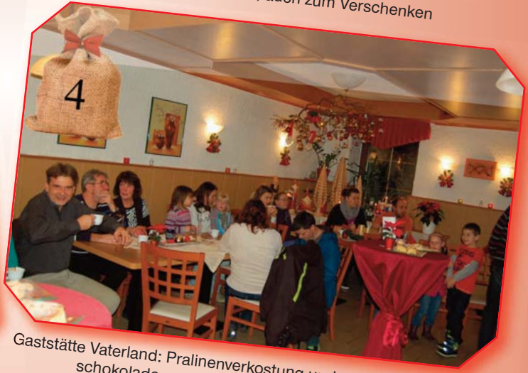
Gaststätte Vaterland: Pralinenverkostung und winterlich heiße Trink- schokolade, umrahmt mit weihnachtlicher Musik.