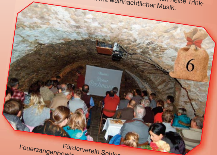
Förderverein Schloss u.T.: Feuerzangenbowle im Schlosskeller mit Filmverführung