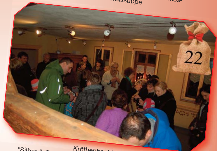
Kröthenbachhäuser: "Silber & Gold" Vortrag des gleichnamigen Weihnachtslie- des und Walnüsse selbst vergolden und versilbern