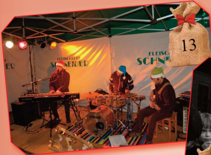
Fleischerei Schneider: christmazzjazz