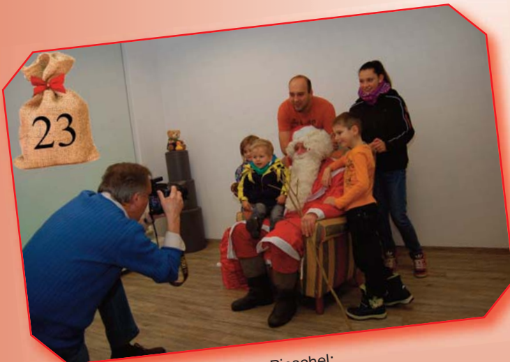
„Selfie mit dem Weihnachtsmann“ Ein lustiger Fotospaß für Groß und Klein