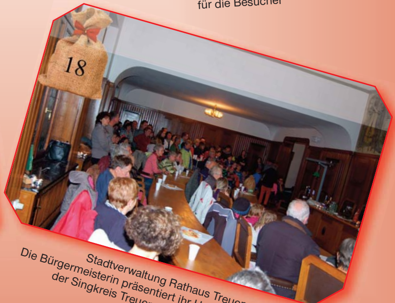
Stadtverwaltung Rathaus Treuen: Die Bürgermeisterin präsentiert ihr Hobby, außerdem singt der Singkreis Treuen weihnachtliche Weisen