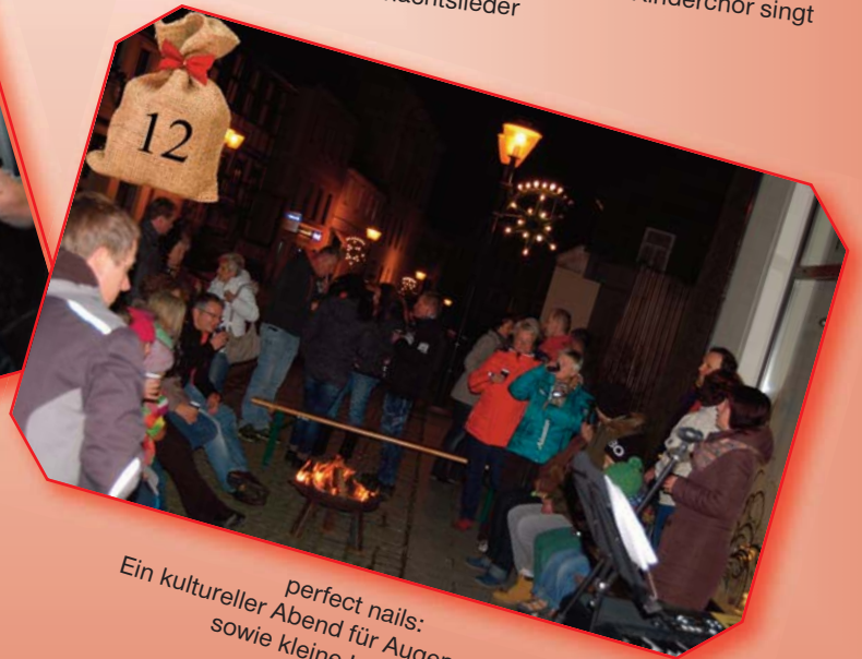
perfect nails: Ein kultureller Abend für Augen und Ohren sowie kleine Leckereien