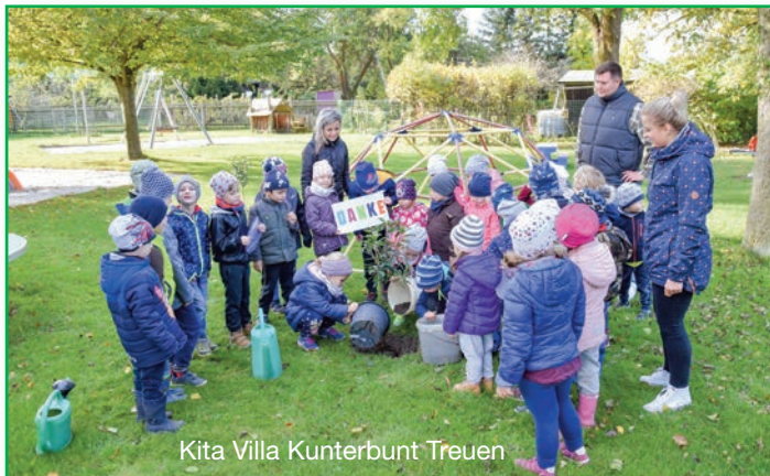
Kita Villa Kunterbunt Treuen