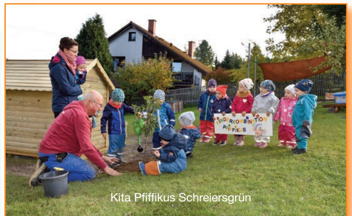
Kita Pfliffikus Schreiersgrün