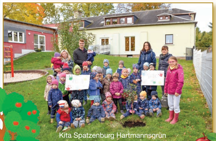
Kita Spatenburg Hartmannsgrün