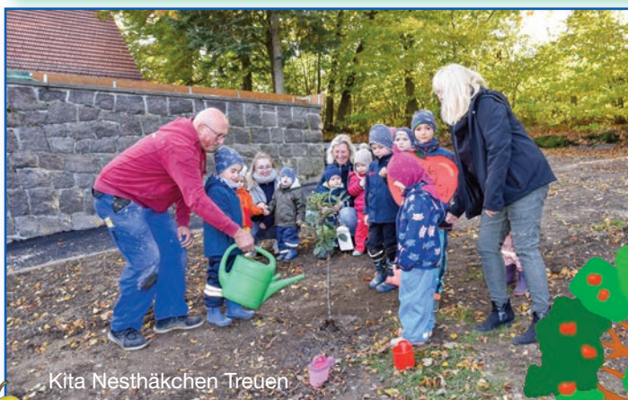
Kita Nesthäkchen Treuen