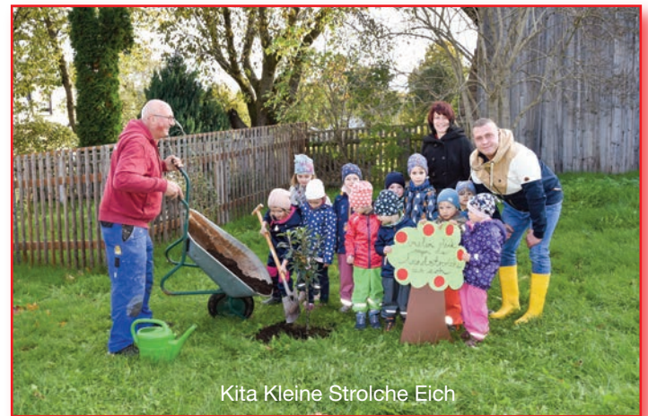
Kita Kleine Strolche Eich

Die restlichen Apfelbäume finden in den kommenden Tagen in Treuen und den Ortsteilen sowie in den Schulen ihren Platz.