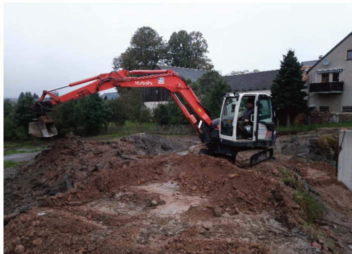
Enrico Mothes vom Treuener Kommunalstützpunkt musste große Erdmassen bewegen.

Die Wasserführung des Lengenfelder Dorfbaches am Eicher Dorfanger ist sehr ungünstig, im oberem Bereich verläuft das Wasser des Baches eher unkontrolliert und zum Teil in die unterliegenden Wiesen. Außerdem befindet sich oberhalb ein Teich, der seit einigen Monaten undicht ist. Die unterliegenden Grundstücke stehen bei längerem Regenwetter dann oft unter Wasser. Eine Unterhaltung des Baches und die Pflege der Wiesen ist dadurch fast unmöglich. Aus diesen Gründen gab es die Überlegung, die unbefriedigende Situation des vorhandenen Bachlaufes des Lengenfelder Stadtbaches im Dorfanger zu verbessern und neu zu gestalten.