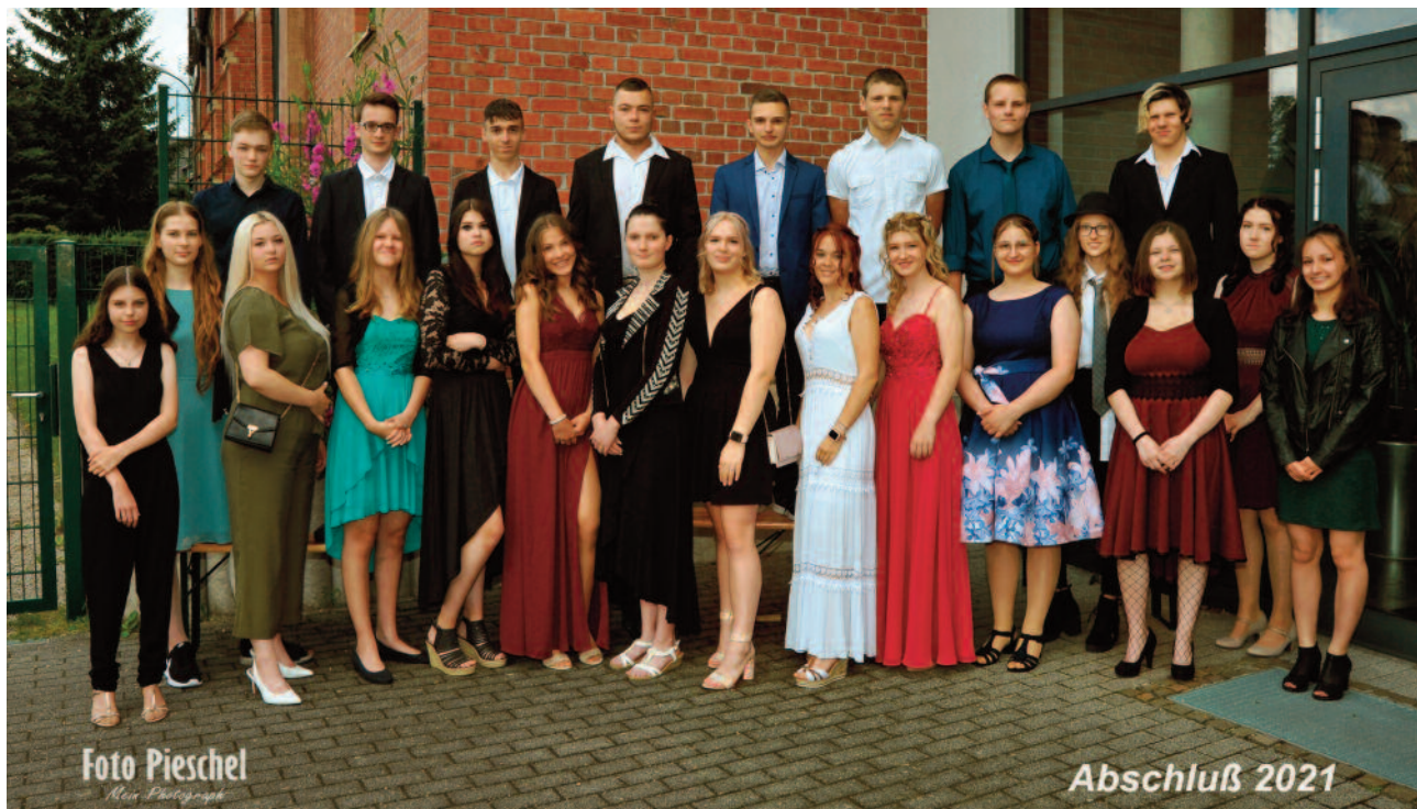
Die Klasse 10b

Für eine feierliche Atmosphäre der Festveranstaltung sorgten Schülerinnen und Schüler der Marienschule mit Gesang, Instrumentalstücken und Gedichten.