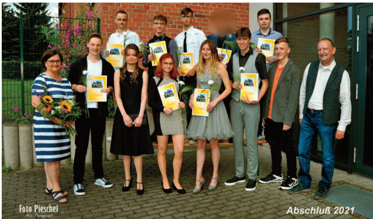
Die Hauptschulgruppe Klasse 9 – drei Schüler erreichten den Qualifizierenden Hauptschulabschluss, acht Schüler ihren Hauptschulabschluss