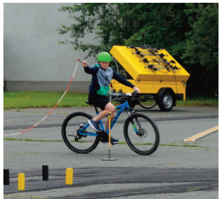
Schüler der Klasse 5 beim ADAC-Fahrradtraining