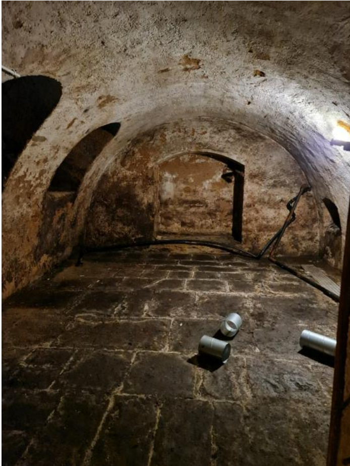
Der Keller unter der Stadtbibliothek soll mit der neuen Technik schnellstmöglich trocken werden.

Die Trockenlegung soll, wie Spitzner formuliert, „mit der Kraft der Sonne“ erfolgen. Hierzu wurden an die Gebäuderückseite 6 Quadratmeter große Solarmodule aufgebaut. Durch die Sonnenenergie wird die Luft in einem unter der Leseterrasse verborgenem Rohrsystem erwärmt, die permanent mit ca. 60 Grad in den Keller strömt.