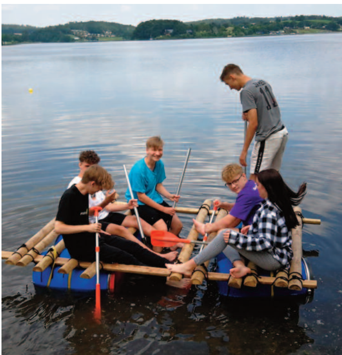
Schüler der Klasse 8a beim Testen ihres Floßes auf der Talsperre Pöhl