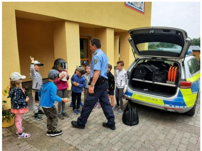
Was befindet sich in einem Polizeiauto?