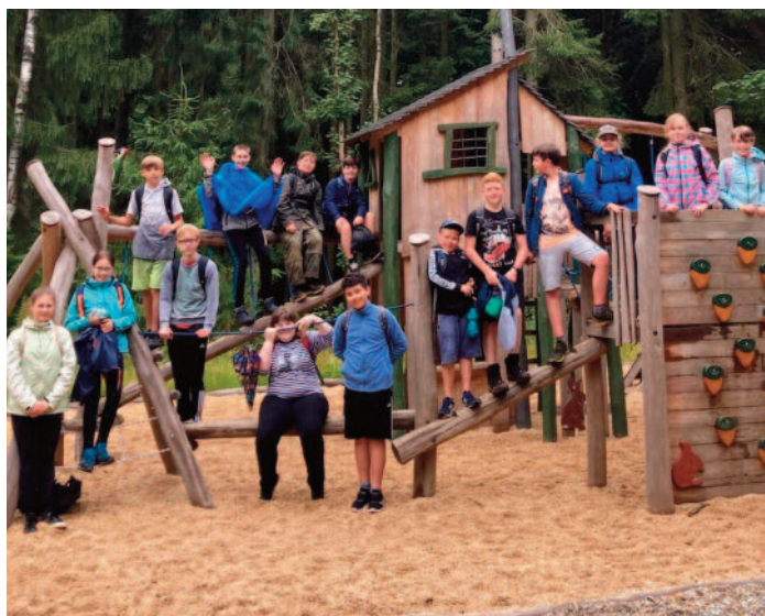
Wandertag der Klasse 5b – Rast am Perlaser Turm