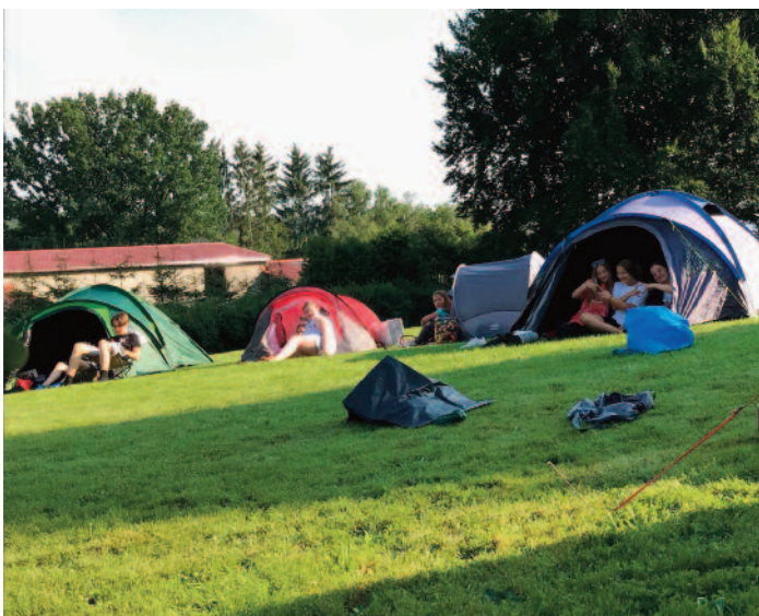
Die Klasse 6a zeltete bei bestem Wetter im Mariengarten