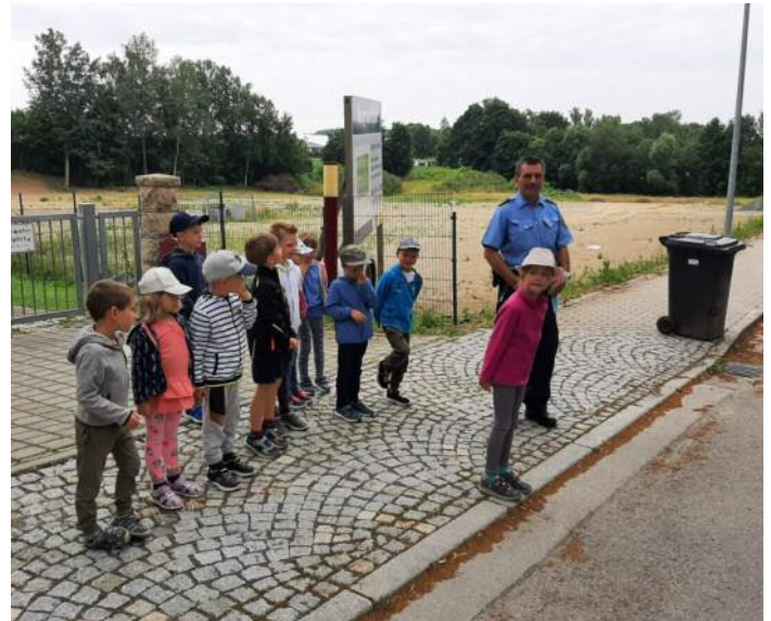
„Sicherer Weg zur Schule“