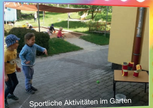
Sportliche Aktivitäten im Garten