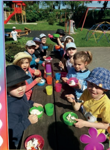
Eisbar zur Erfrischung

Bis bald, die Kinder und das Team vom „Nesthäkchen“