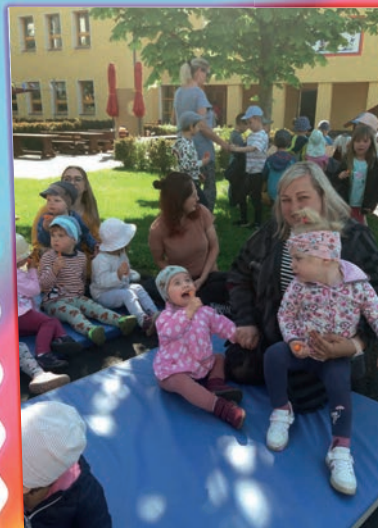
Unsere Krippe freute sich über die bunten Seifenblasen