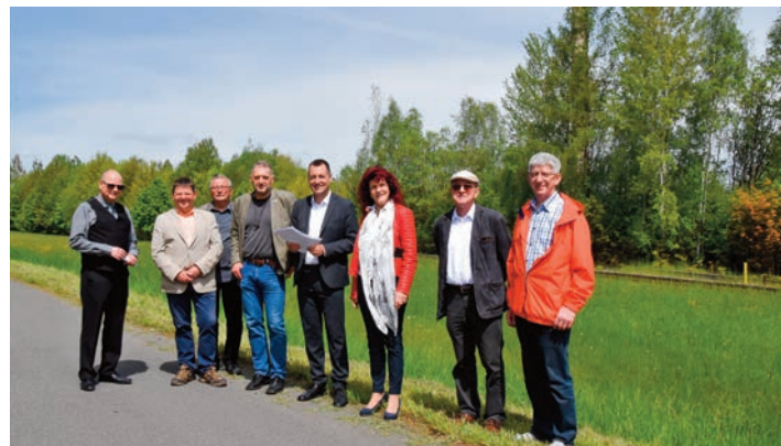
Vertreter fast aller Ratsfraktionen waren zum Ortstermin anwesend. Circa 300 Meter vom ehemaligen Bahnhof entfernt kann man sich einen Bedarfshaltepunkt gut vorstellen. Aus Sicht der Stadt Treuen wären dort die Voraussetzungen optimal.