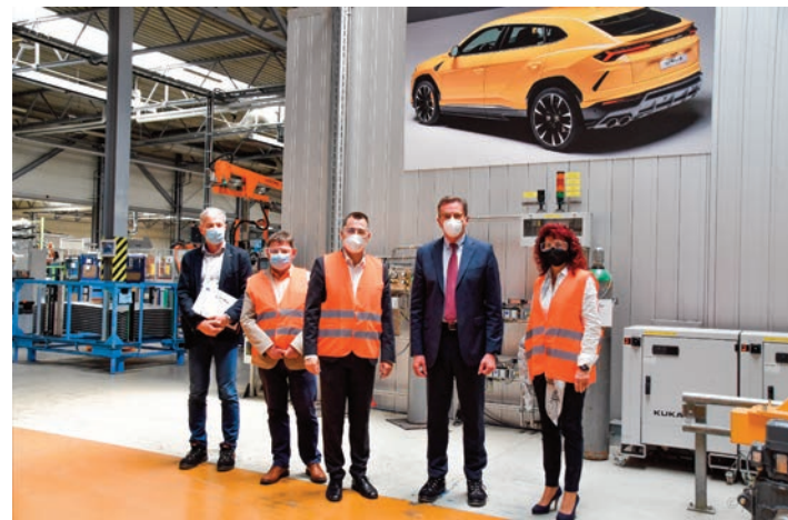
Im Anschluss an den Ortstermin in Eich, besichtigte eine kleine Delegation zusammen mit MdL Torsten Herbst die Firma MA Automotive im Treuener Gewerbegebiet. Herbst war sichtlich beeindruckt von der Produktionsstätte für Automobilteile.