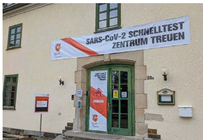
Das Testzentrum in der Goethehalle hat am 18. Juni letztmalig geöffnet.

damit einen Beitrag zur Pandemiebekämpfung leisten zu können.