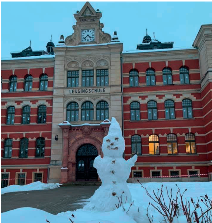
Ein Schneemann an der Schule begrüßte alle Kinder und Bürger, die an ihm vorübergingen und hofft, dass bald wieder reges Treiben in allen Schulräumen ist.

In der Ortschaft Eich wurden auch in diesem Jahr, dank dem schneereichen Winterwetter, wieder die Loipen gespurt. Insgesamt 19 Kilometer wurden präpariert. Durch die Streckenlänge konnten bei ausreichend Abstand viele Eicher und Bürger aus dem Umland frische Luft tanken und sportlich was für die Gesundheit tun.