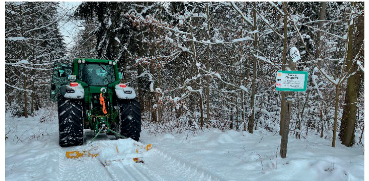
Beim Spuren der Loipen kam schweres Gerät zum Einsatz, so stellte ein Ortsansässiger Landwirt seinen Traktor zur Verfügung.

Aktuelle Informationen finden Sie unter www.eich-sachsen.de