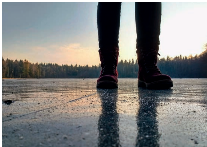
Das Betreten zugefrorener Seen birgt eine große Gefahr!

Ihre Feuerwehr gibt Tipps zum Verhalten an Eisflächen. Der Deutsche Feuerwehrverband (DFV) warnt vor dem Betreten nicht freigegebener Eisflächen: „Trotz der Minusgrade sind viele Eisflächen zu dünn; es droht Einbruch“, erklärt DFV-Vizepräsident Hermann Schreck. Auch der vielfach in Deutschland herrschende Frost der vergangenen Tage garantiert nicht, dass die Eisdecke auf Seen oder Flüssen tragfähig ist. Besonders Kinder lassen sich vom glitzernden Eis zu unvorsichtigem Verhalten verleiten. „Betreten Sie nur freigegebene Eisflächen!“, mahnt Schreck. Für die Freigabe sind die örtlichen Behörden zuständig.