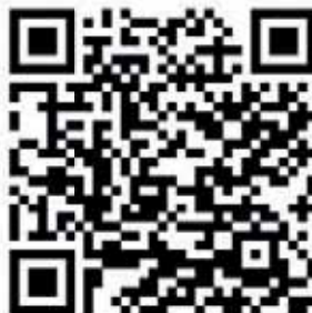
NINA für Android