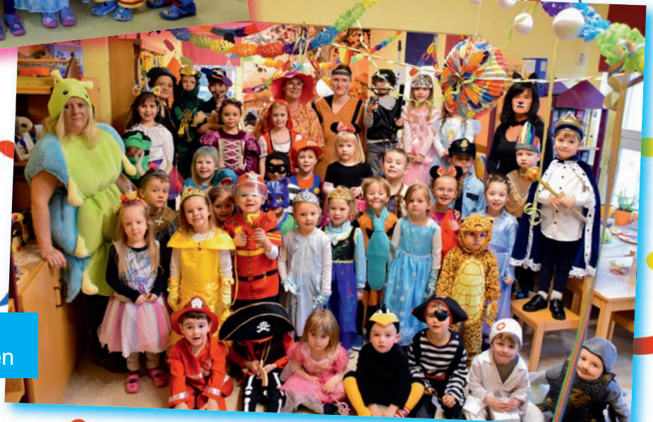
Kinderkombination „Nesthäkchen“, Treuen