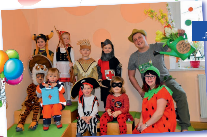
Kindertagesstätte „Pffikus“, Schreiersgrün