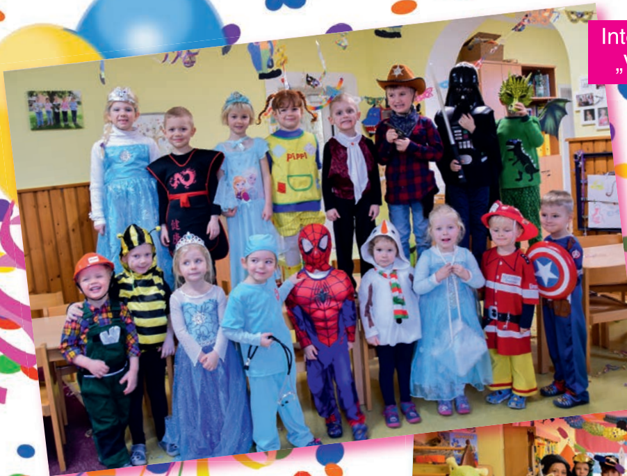
Integrative Kindertagesstätte „Villa Kunterbunt“, Treuen