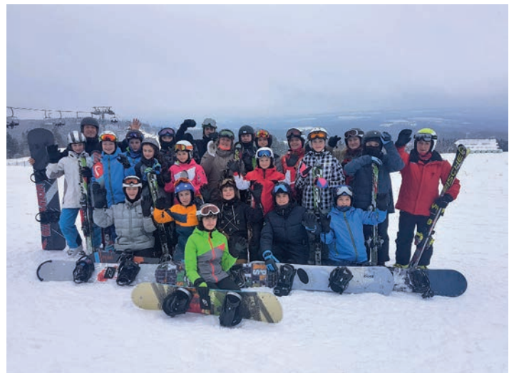
Gruppenbild mit den Teilnehmern des diesjährigen Skilagers. Text: Mönning

Die Treuener Mittelschule führte vom 03.02. bis zum 07.02.2020 in Schöneck ihr bereits elftes Winterlager durch. 20 Mädchen und Jungen der Klassenstufen 5 bis 8 konnten in dieser Woche das Skifahren oder Snowboarden erlernen bzw. ihre Fähigkeiten verbessern. Untergebracht waren sie wie in den Vorjahren im