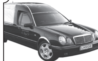
Auf allen Friedhöfen zugelassen.

Am Park 2 | 08485 Lengelfeld | post@park-gaststaette.eu