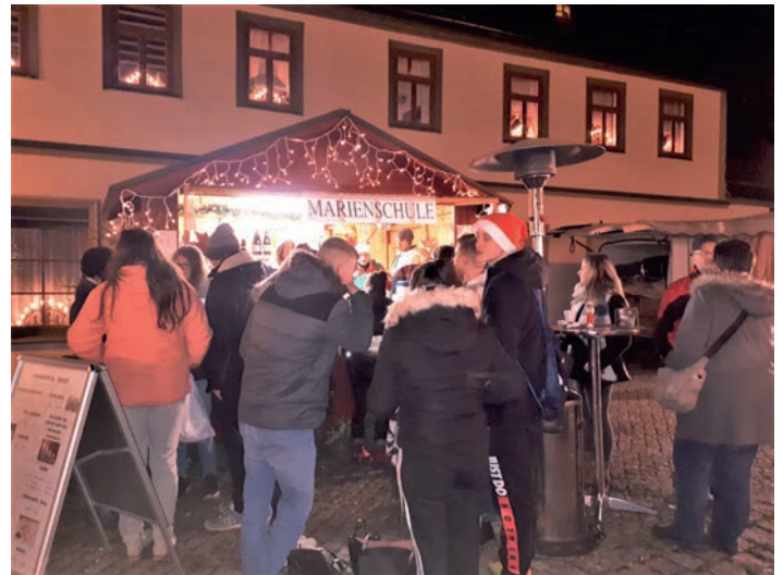
Dicht umlagert war der Stand der Marienschule an beiden Tagen.