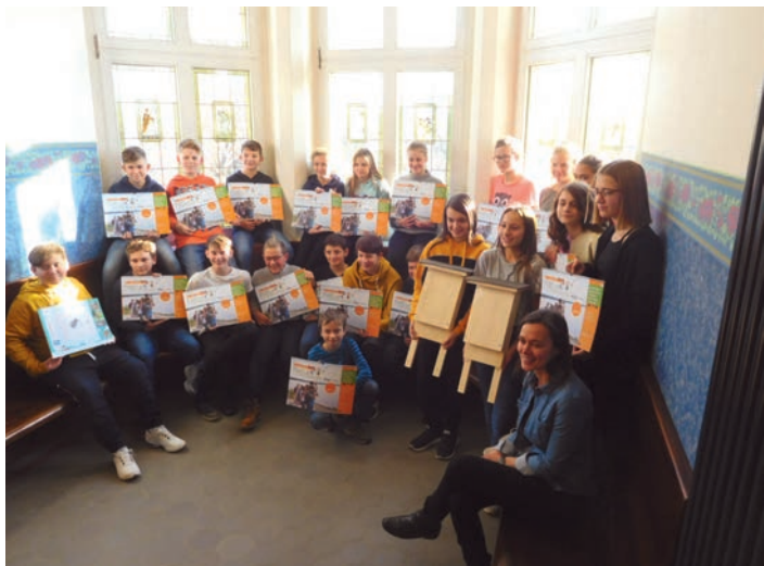
Die Klasse 6b mit den gewonnenen Jahreskalendern