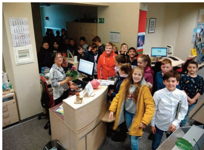
Mit Interesse folgten die Schüler der Klasse 5a den Ausführungen.