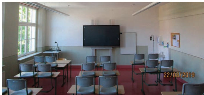
Das Zimmer 23 hier bereits mit interaktivem Display

102.000 € konnten mit 95.151,49 € unterschritten werden. Alle weiteren Mittel nach VwV Invest Schule stehen für den 1. Bauabschnitt der Sanierung der Schulturnhalle Thoßfell zur Verfügung, die nach Ostern 2020 beginnen soll.