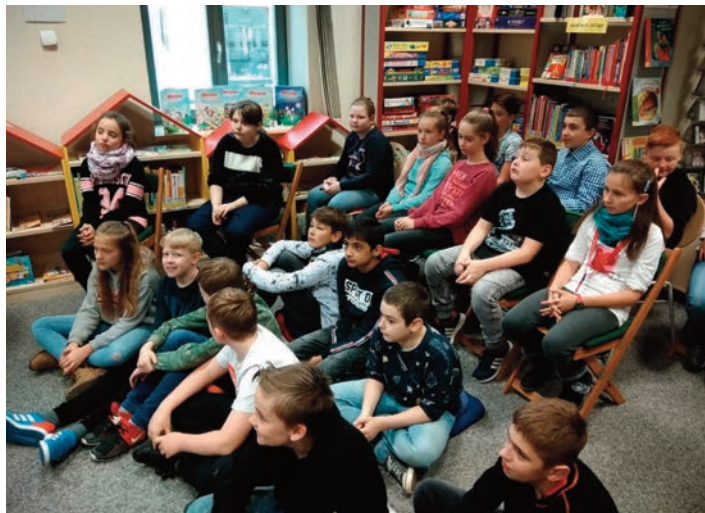
Viele konnten sich nur schwer von den interessanten Büchern trennen.

Auch wie man Mitglied werden kann und wie die Ausleihe funktioniert, das wurde den Schülern anschaulich erklärt. Im Anschluss mussten die Schüler in Gruppen selbst kleine Aufgaben lösen, was aber alle mit Bravour meisterten. Dabei verging die Zeit viel zu schnell und nach 90 Minuten konnten sich einige Schüler nur schwer von den vielen interessanten Büchern trennen. Ein Dank gilt an dieser Stelle den Mitarbeitern der Stadt- und Schulbibliothek, die die Schüler auf interessante Art und Weise mit der Arbeit in einer Bibliothek vertraut machten.