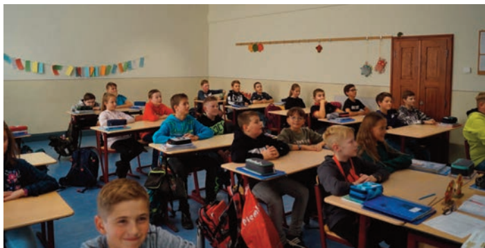
Die Klasse 5a in ihrem neuen Klassenzimmer

Mit Förderung aus dem Sächsischen Investitionskraftstärkungsgesetz „Brücken in die Zukunft“ nach VwV Invest Schule wurden in den vergangenen Sommerferien in zehn Klassenzimmern der Marienschule Treuen Akustikdecken eingebaut und neue LED-Leuchten installiert. Entsprechend der VwV Invest Schule erfolgten auf der Grundlage von Schülerzahlen pauschale Zuweisungen an die Verbandsgemeinden Treuen und Neuensalz. Das Gesamtbudget