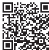
NINA für Android