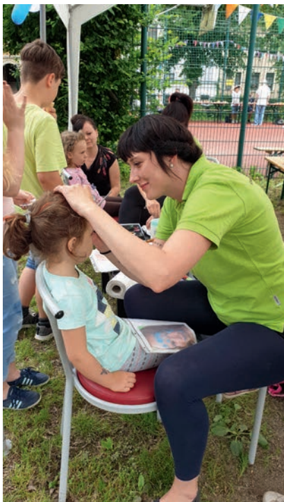
Euer Team vom Kinder- und Jugendzentrum

Schön war's, in diesem Sinne bis zum nächsten Jahr!