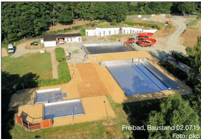
Freibad, Baustand 02.07.19

Die Bauarbeiten im Treuener Freibad laufen auf Hochtouren, denn laut Bauablaufplan könnte das Freibad im August für den Badebetrieb öffnen. Trotzdem gibt es noch einiges zutun bis man ins kühle Nass springen kann. Wir freuen uns sehr, dass nun die Edelstahlbecken endlich fertig geschweißt sind, was aufgrund der Temperaturschwankungen in den letzten Monaten leider nicht möglich war. So konnten in dieser Woche die neuen Becken gereinigt und langsam mit der Befüllung begonnen werden. Parallel dazu laufen weiterhin die Pflaster- und Tiefbauarbeiten. Gerade die Pflasterar-