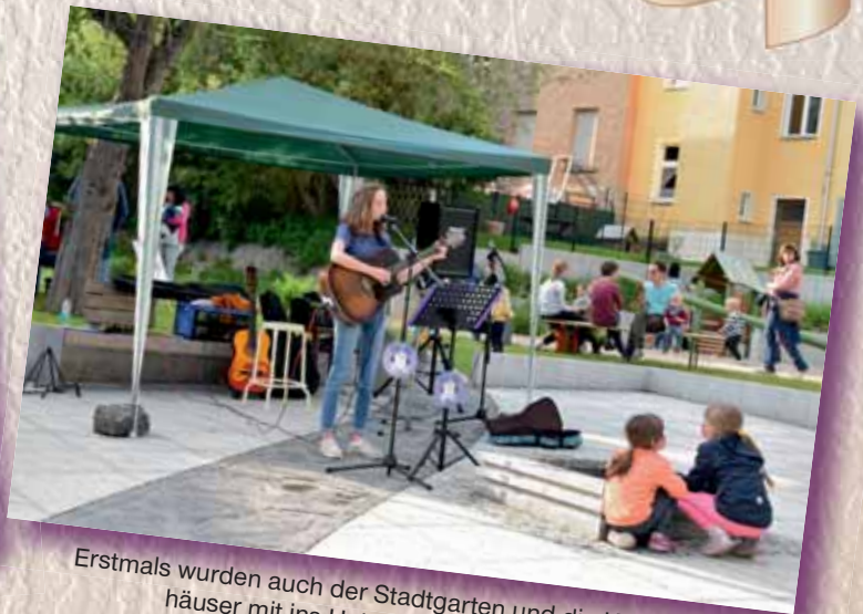
Erstmals wurden auch der Stadtgarten und die Krötenbachhäuser mit ins Hutzentagareal einbezogen.