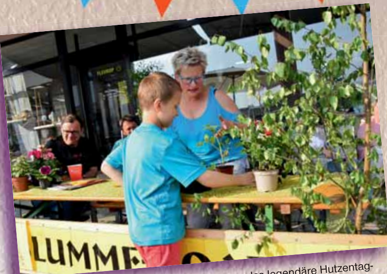
Mittelpunkt des Hutzentages war wie immer das legendäre Hutzentag-Gaudium. Beim „Blumme roatn“ am Stand vom Blumengeschäft Herrgeist konnte man seine botanischen Kenntnisse überprüfen.