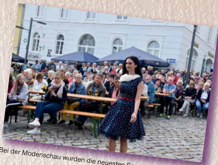
Bei der Modenschau wurden die neuesten Sommertrends 2019 gezeigt.