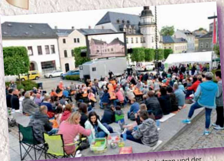
Bereits am Freitagabend beim Anhutzen und der 3. Treuener Filmnacht war der Marktplatz sehr gut gefüllt.