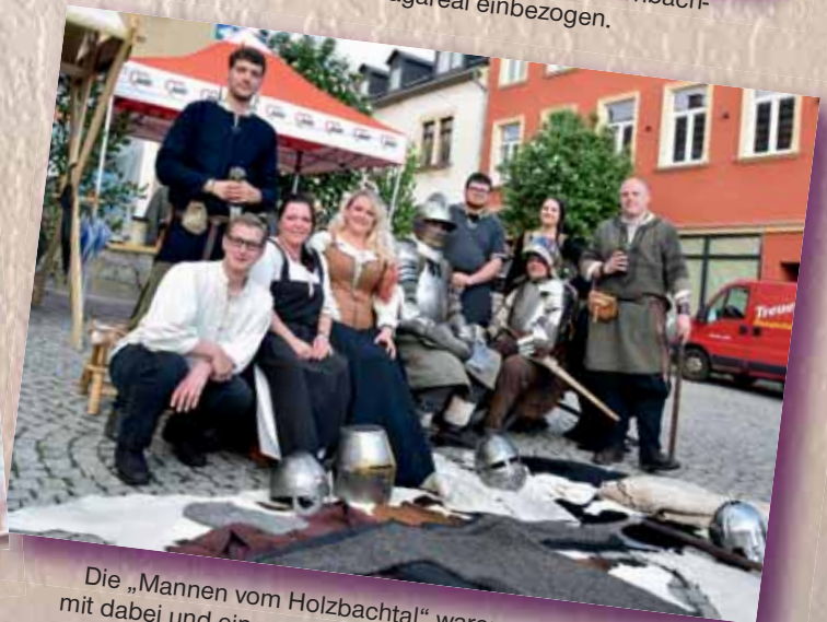
Die „Mannen vom Holzbachtal“ waren zum ersten Mal mit dabei und eine große Bereicherung für den Hutzentag.