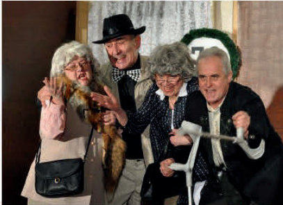
Der Kartenvorverkauf startet Anfang März 2019

Vorankündigung für 2019: am 13. April 2019 gastiert wieder das Kottengrüner Trämpele bei uns in der Gaststätte Tiepner