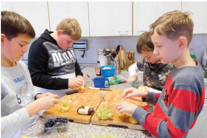
Für einen Projekttag „Gesunde Ernährung“ nutzten Schüler der vierten Klassen der Lessingschule die moderne Hauswirtschaftsküche der Oberschule.

Am 02. Februar 2019 besteht anlässlich des Tages der offenen Tür von 10.00 bis 12.00 Uhr nochmals die Möglichkeit der Marienschule einen Besuch abzustatten. Dazu sind alle Interessierten ebenfalls recht herzlich eingeladen. Lehrer und Schüler der Marienschule freuen sich über Ihren Besuch.