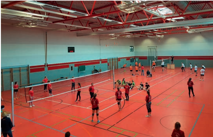
Traditionell fand das Nikolausturnier im Volleyball in Treuen statt.

Am Ende siegten nach spannenden Spielen die Jungen aus Netzschkau sowie die Mädchen aus Lengelfeld.