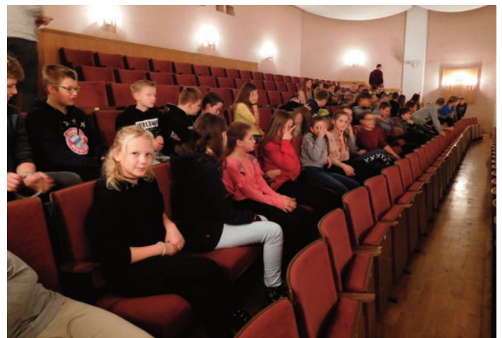
Schüler der Marienschule im Neuberinhaus Tolle Schauspieler und ein tolles Bühnenbild ließen die Vorstellung zu einem Erlebnis werden.