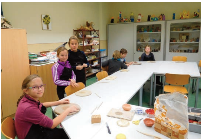
Eine Tonschale stellte in der Zwischenzeit die jeweils andere Klassenhälfte her.