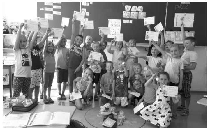
Schüler der Klasse 1 freuen sich über die Urkunden und Medaillen