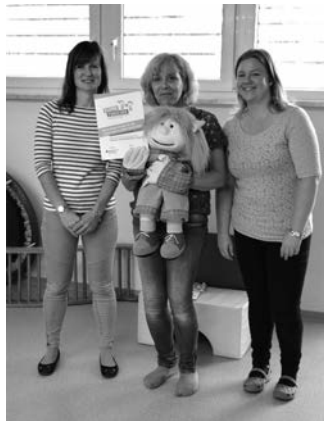
Texte/Fotos: Kita Märchenland

Bereits zum 4. Mal wurden wir am 24.09.2018 von der IHK Chemnitz in Vertretung von Frau Behr offiziell zum „Haus der kleinen Forscher“ zertifiziert. Durch alltägliches Forschen in der Einrichtung wird die frühkindliche naturwissenschaftliche Bildung gefördert. Unsere erhaltene Plakette wird zukünftig am Eingang zu sehen sein. Die Kinder freuen sich auch weiterhin auf viele Möglichkeiten zum Experimentieren in den Themenbereichen Mathematik, Informatik, Naturwissenschaften und Technik.