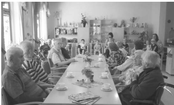
Text/Bild: DRK Treuen

Generationsübergreifende Treffen werden in der DRK Tagespflege Treuen groß geschrieben. Regelmäßig treffen sich unsere Senioren mit den Kindern verschiedener Treuener Kindertagesstätten. Dabei wird gesungen, gebastelt, gebacken oder sich sportlich betätigt. Beide Seiten können von diesen Erlebnissen profitieren. Die Kinder lernen bereits früh den Umgang mit älteren Menschen und erweitern mit ihrer kindlichen Neugier und Lebensfreude die Welt der Senioren. Ältere Menschen reagieren positiv auf Kinder und nehmen gern an gemeinsamen Aktivitäten teil. Dadurch werden sie körperlich und geistig mobilisiert. Gemeinsam üben sich Kinder und Senioren in Wertschätzung und gegenseitiger Rücksichtnahme. Im August waren die Kinder der DRK-Kita „Märchenland“ zu Gast. Wir haben neben sportlichen Einlagen viel erzählt und gelacht. Im September besuchte uns eine Gruppe der „Villa Kunterbunt“ in der DRK-Tagespflege. Gemeinsam mit den Senioren wurde gesungen und sich sportlich betätigt. Die Besucher der Seniorentagespflege freuen sich bereits auf den nächsten Besuch ihrer kleinen Gäste.