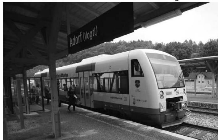
Zum Tag der Vogtländer am 8. September kann man bequem mit Bus oder Bahn nach Adorf fahren.

Aus Richtung Gera können Besucher die Linie RB 4 bis Weischlitz nutzen und dann auf die Linie RB 2 umsteigen.