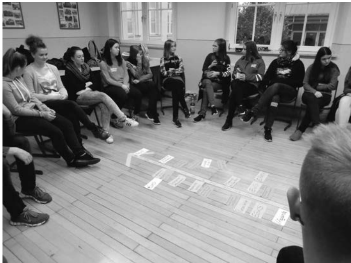
Diskussionsrunde der Klasse 10b

Der Projekttag begann mit einer kurzen Vorstellungsrunde, bevor die Geschichte der EU von Kriegsende bis heute betrachtet wurde. Danach folgten diverse Gruppenarbeiten, bei denen sich die jeweiligen Schüler zu einigen Thesen äußern mussten oder eine Europakarte als Wettbewerb zusammenpuzzeln sollten. Zwischendurch lockerten Spiele die Atmosphäre auf. Des Weiteren wurde sich über die aktuell politischen Themen der EU unterhalten und verschiedene Institutionen vorgestellt und bearbeitet. Nachdem eine Wandzeitung mit der Überschrift „EU im Alltag“ erstellt wurde, hatten die Schüler die Möglichkeit auf einem anonymen Fragebogen ihr Feedback zu dem Projekttag zu geben.