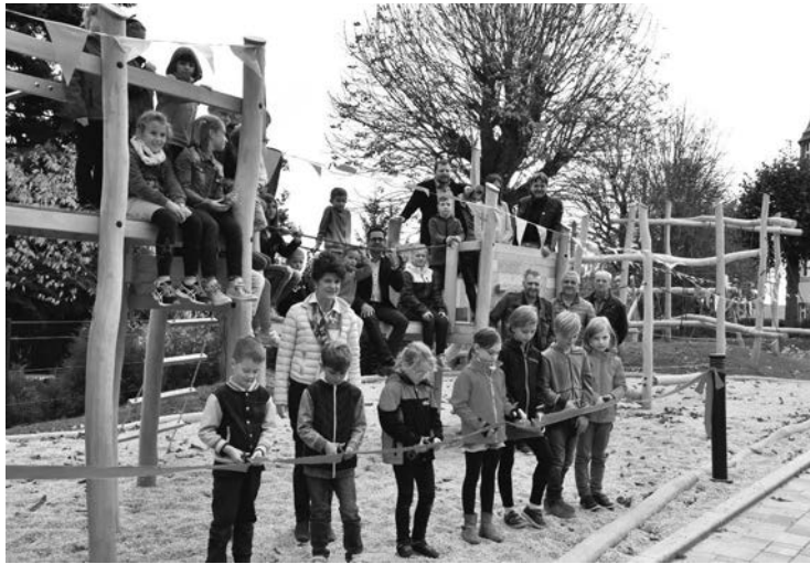
Das Durchtrennen des symbolischen Bandes übernahmen die Hortkinder.