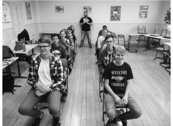
Bus-Spiel der Klasse 10a

Text: Lukas Lorber • Fotos: V. Bhardwaj/A. Mönnig/ L. Lorber