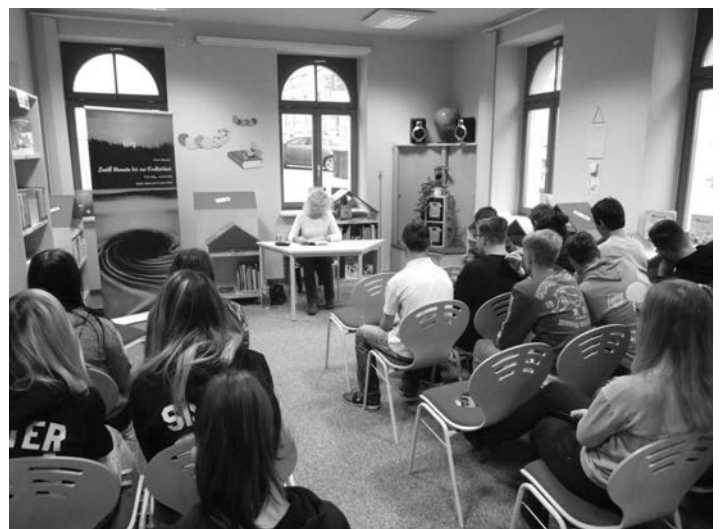
Schüler der Klasse 9b während der Buchlesung in der Treuener Stadtbibliothek