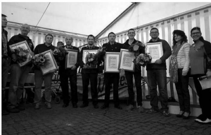
Mit einer Ehrenurkunde wurden Rettungskräfte und Feuerwehren zum Ehrenmitglied der AWO ernannt.

Am 22. September veranstaltete die AWO Auerbach für alle Rettungskräfte und Freiwilligen Feuerwehren ein Dankesfest im Seniorenzentrum Neue Welt Treuen. Bezugnehmend auf den Brand am 29. Mai im Seniorenzentrum hat die AWO sehr viel Hilfe erhalten und wollte somit Danke sagen. Bei bester Stimmung, gutem Essen und toller Musik hatten alle sichtlich Spaß.