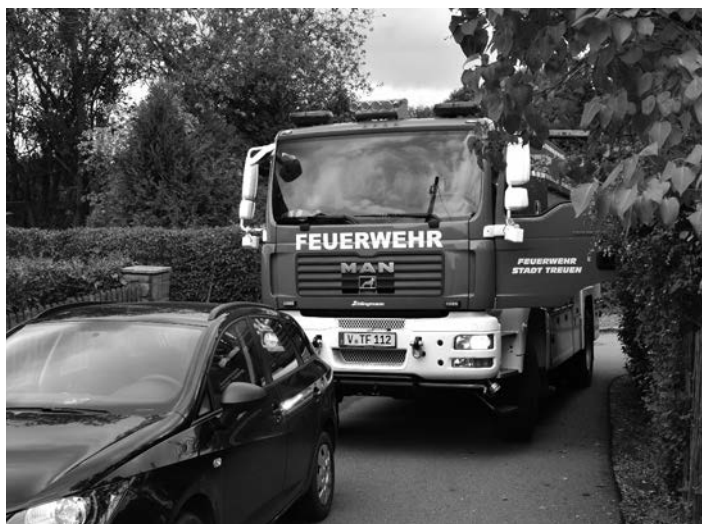
Solche Situationen begegnen Führern von Rettungsfahrzeugen leider immer wieder. Ein Durchkommen ist unmöglich. Das Tanklöschfahrzeug der Feuerwehr Treuen hat eine Breite von 2,55 m. Foto: Stadt Treuen, Symbolbild