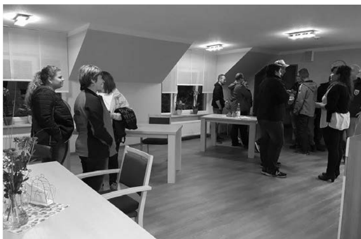
Die Möglichkeit, die neu renovierten Räumlichkeiten zu besichtigen nahmen alle gern an.