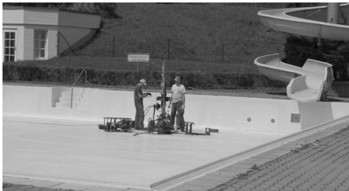
Mitarbeiter der Firma „G.U.B. Ingenieur AG“ bohrten zur Ermittlung der Untergrundbeschaffenheit an mehreren Stellen.

Wir danken Ihnen für Ihr Verständnis und freuen uns auf Ihren Besuch!