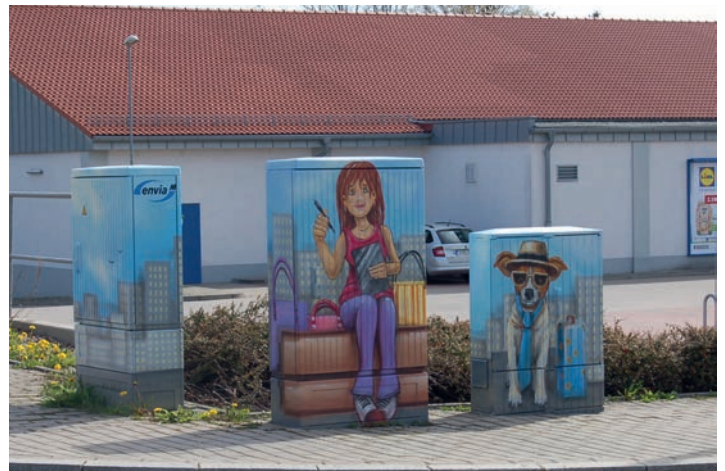
Eine lustige Reisende mit ihrem Hund wartet auf der Oststraße, unweit der Schnittstelle des ÖPNV auf ihre Fahrgelegenheit.