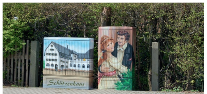
An der Ecke Innere Herlasgrüner Straße/Wetzelsgrüner Straße kann man nun wieder das ehemalige Schützenhaus bewundern, welches sich bis kurz nach der Wende auf der anderen Straßenseite befand. Sicherlich verbinden einige viele Erinnerungen mit dem Anblick dieses Bildes.