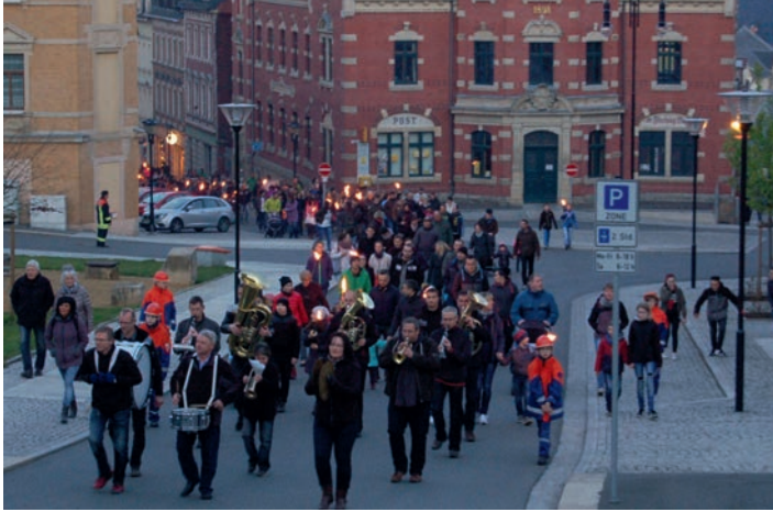
Mit Marschmusik führte die Kapelle Volltakt den Fackelumzug an.