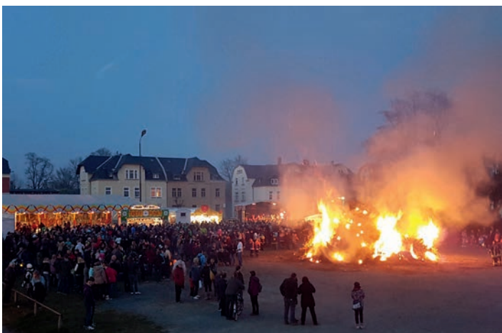
Gegen 21 Uhr entzündeten die Fackelträger das Feuer.

Der Fackelumzug durch die Innenstadt, der durch die Kapelle „Volltakt“ angeführt wurde, schien gar kein Ende zu nehmen, so viele Treuener und Gäste machten sich auf dem Weg zum Turnerbundplatz. Dort wurde das Höhenfeuer durch die Fackeln der Kinder entzündet. Zum ersten Mal mit im Boot waren die KulturBanausen, die sich zusammen mit der Privatbrauerei Blechschmidt für die Verpflegung auf dem Turnerbundplatz verantwortlich zeigten. Autoskooter, Schießbude und Co. war neben dem lodernnden Feuer ein weiterer Höhepunkt. Bis in die Nacht sorgten „Volltakt“ und die Diskothek Kraftwerk für ausgelassene Stimmung unter den Besuchern.