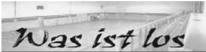
in der Multifunktionalen Zweifeldsporthalle