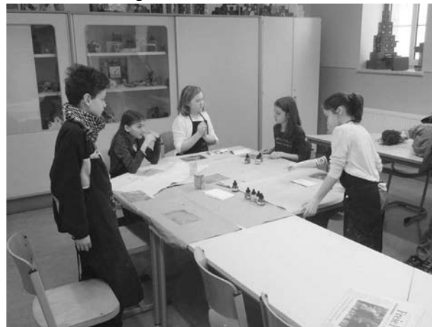
Kreativität war im Kunsterziehungskabinett gefragt.

Reges Treiben herrschte aber auch in den anderen Fachkabinetten. Auf besonderes Interesse stieß in diesem Jahr erneut eine Gruppe von ehemaligen und aktuellen Schülern der Marien-Oberschule, die sich der Wikingerzeit verschrieben haben. Mit ihren Foltergeräten, Rüstungen, Waffen und sonstigem Zubehör sorgten „Die Mannen vom Holzbachtal“ für ein tolles Flair im Schulhaus. So war besonders die Schandgeige bei den Besuchern gefürchtet.