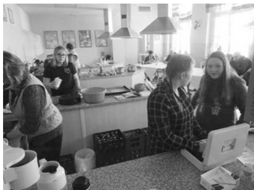
Fleißige Helfer versorgten die Gäste in der modernen Hauswirtschaftsküche.

Selbstverständlich stand am Ende des Rundganges auch wieder ein kleiner Imbiss in der modernen Hauswirtschaftsküche für alle bereit. Dies nutzten dann auch wieder viele „Ehemalige“, die an diesem Tag wieder mit ihren ehemaligen Lehrern ins Gespräch kamen.