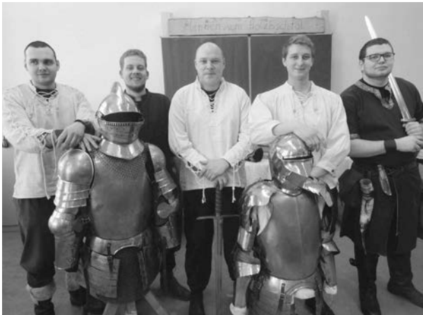
Die „Mannen vom Holzbachtal“ unterstützten auch in diesem Jahr den Tag der offenen Tür tatkräftig.

Jedes Fach hatte sich mit vielen unterschiedlichen Betätigungsmöglichkeiten auf die zahlreichen Gäste eingestellt. Alle Fragen wurden durch die Fachlehrer der Schule beantwortet.