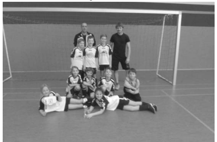
Die F-Jugend der SG Pfaffengrün wurde Dritter beim eigenen Turnier

Bei den sportlichen Vergleichen blieb es aufgrund des ausgeglichenen Teilnehmerfeldes bei allen Wettkämpfen bis zum Schluss spannend. Es wurden zum einen die drei Erstplatzierten mit Pokalen ausgezeichnet und zum anderen wurde in jedem Turnier auch der beste Spieler und der beste Torwart gewählt, bzw. der Torschützenkönig ermittelt.