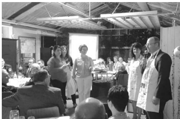
Die Gärtnerei „Florale Schmiede“ bot ein ausgezeichnetes Ambiente, um das Jubiläum zu feiern.