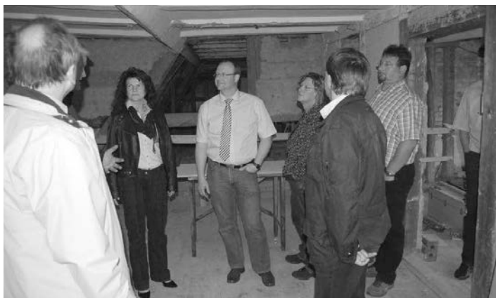
Schlossfest August 2016: Es gibt noch viel zu tun.

Heute kann die Verwaltung der Stadt Treuen mit ihren Erfahrungen beim Umstieg auf das neue Haushaltsrecht „Kommunale Doppik“ der Gemeinde Dettenhausen unterstützend zur Seite stehen, denn dieser Umstieg steht den dortigen Kommunen baldigst bevor. Für die sächsischen Städte und Gemeinden war die Einführung der kommunalen Doppik bereits ab dem Jahr 2013 verpflichtend; in Baden-Württemberg wird gegenwärtig auf das neue Haushaltsrecht umgestellt.