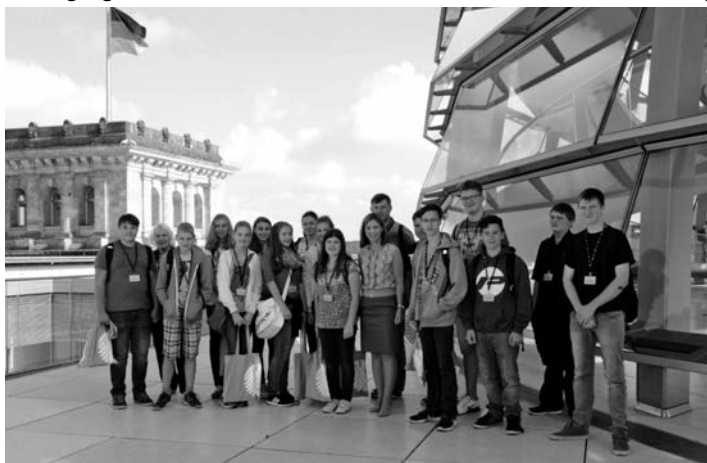
Die Klasse wurde von der Bundestagsabgeordneten, Frau Ivonne Magwas, empfangen.