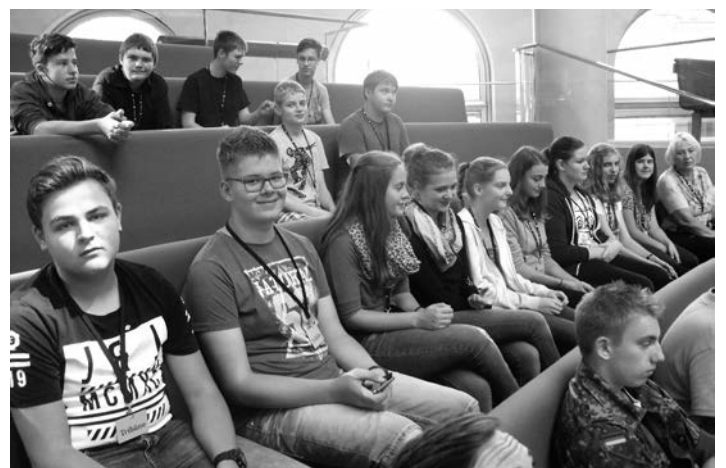
Im Bundestag konnte die Klasse an einem Informationsvortrag teilnehmen.

Nachdem die Nacht genossen wurde, ging es am Mittwochmorgen um 10.00 Uhr zum Berliner Bundestag. Dort fand eine einstündige Informationsstunde auf der Besuchertribüne des Plenarsaals statt, bei der die Schüler viel Wissenswertes erfahren haben und Fragen stellen konnten. Nach diesem Informati-