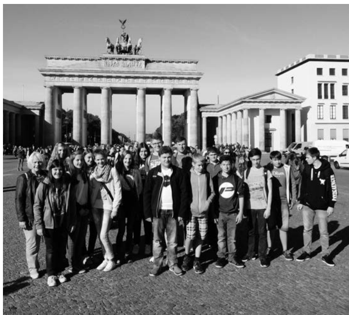
Auch das Brandenburger Tor stand natürlich auf dem Besuchsprogramm.

Text: Lukas Lorber • Bilder: Bundestag/L.Lorber/A. Mönnig