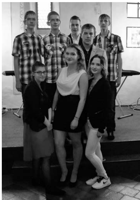
Die Hauptschulgruppe der Klassen 9a und 9b

Text: A. Mönning